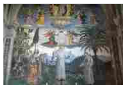
STORIE SAN BERNARDINO DA SIENA (CAPPELLA BUFALINI) BERNARDINO DI BETTO BETTI (PINTURICCHIO) BASILICA DI SANTA MARIA IN ARACOELI