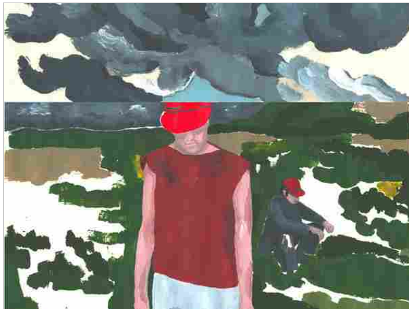
Opera di Elena Pagliani

Dal 02 Dicembre 2021 al 05 Dicembre 2021