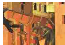
PINACOTECA NAZIONALE DI SIENA SIENA